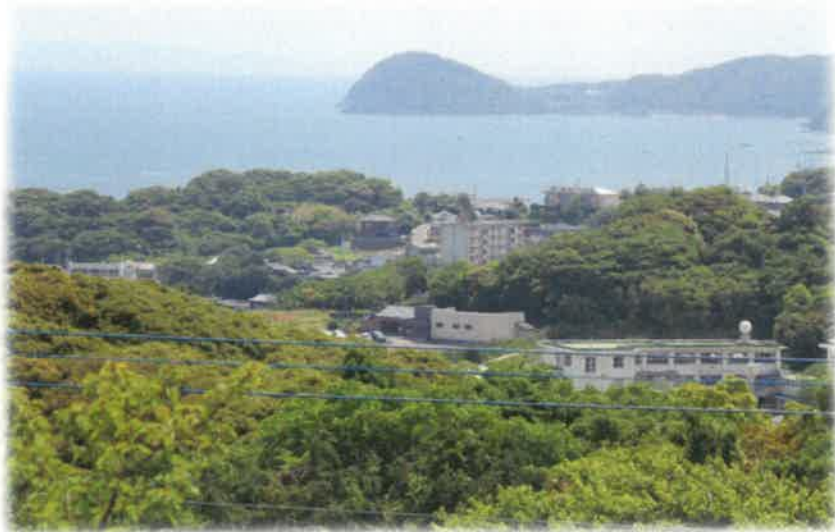
万葉公園から望む石田野